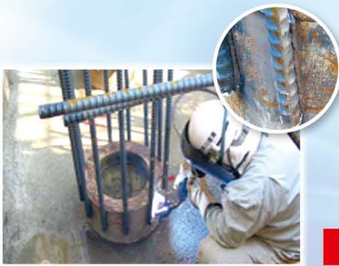
従来のフレア溶接工法(立向上進法)