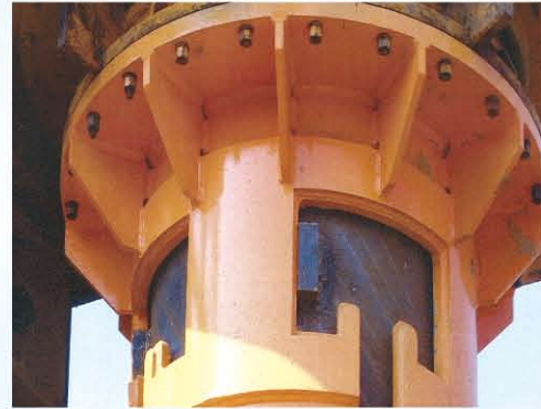
◎杭施工状況例(吊り込み)